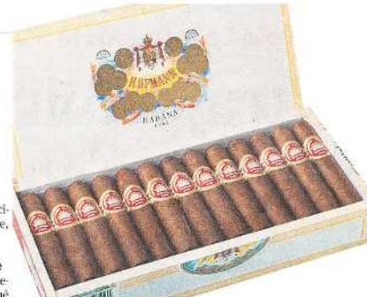
Ce half-corona de H. Upmann offre une belle harmonie. LEO

Oui et non. Le cas perdure pour ces grands formats en raison du temps important nécessaire à leur dégustation. Mais le format Sublimas, considéré comme une grande taille au fort diamètre, connaît un succès sans précédent. Pour marquer l'importance de ce