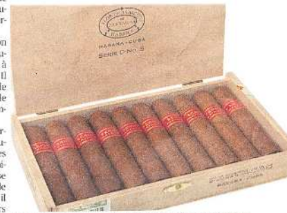
Le D5 de Partagas est un demi-robusto très populaire. LEO

format, Cohiba vient de sortir, dans une série limitée 2011, le 1966 présenté en boîte de dix pièces. Ce cigare, d'ores et déjà excellent, n'en sera que meilleur après quelques années de maturation.